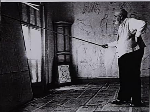
▲ La manera en que el artista plástico percibe el mundo que lo rodea es uno de los temas de la psicología de la percepción.