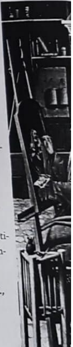
► Quentin Massys, San Lucas pintando a la Virgen , s.d., tabla 114 x 35 cm. National Gallery, Londres. El cuadro representa a un artista del siglo XV en su trabajo de pintor.