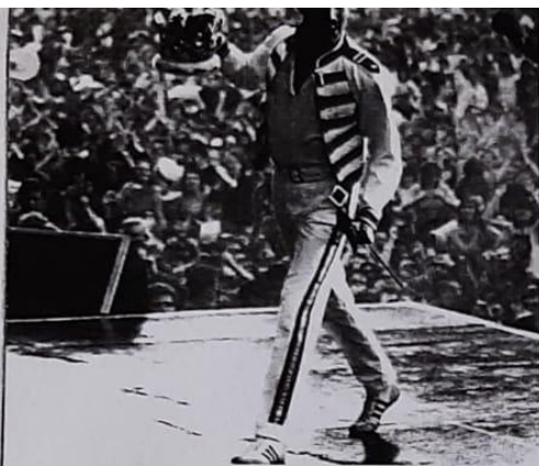
▲ Durante los recitales, la percepción auditiva con empleo de instrumentos amplificados puede llegar a niveles cercanos a lo no tolerable.

Arquitectura: es una disciplina cuyo objetivo es la construcción de edificios perdurables. Sigue determinadas reglas, con el objeto de crear obras adecuadas a su propósito, agradables a la vista y capaces de provocar un placer estético. Es decir, la arquitectura no depende sólo del gusto o de los cánones estéticos, sino que considera una serie de cuestiones prácticas, estrechamente relacionadas entre sí —como la elección de los materiales y su puesta en obra, la disposición estructural de las cargas y el precepto fundamental del uso al que está destinado el edificio—.