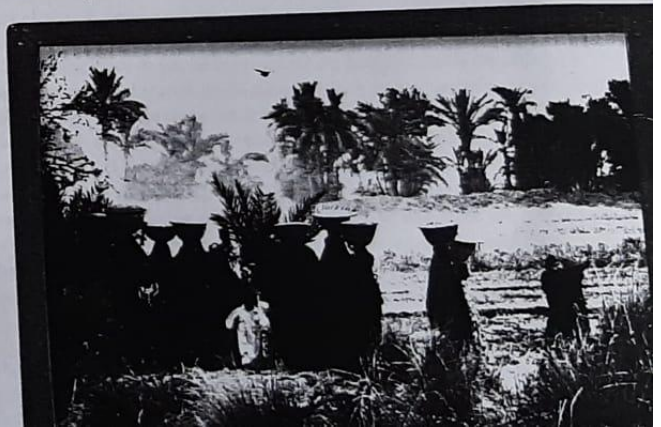
Procesión para llevar alimentos a los muertos en Egipto.

La cultura es algo inherente al hombre. No se puede concebir la existencia de este sin una cultura que lo defina como perteneciente a un grupo humano con su propia idiosincrasia. En este proceso de socialización, se articulan las instituciones, que desempeñan un papel fundamental al referirse a las costumbres, las creencias, las pautas culturales que definen a cada grupo y, por lo tanto, a cada cultura. Desde los comienzos de la humanidad, distintos grupos sociales han establecido, para cada época y para cada región geográfica, sus propias pautas culturales. Cada sociedad desarrolla así rasgos culturales que la caracterizan. Sin embargo, a partir de la segunda mitad del siglo XX, se produjeron intensos cambios que modificaron las relaciones entre los miembros de las diversas comunidades. Este proceso, llamado globalización, implica la pérdida de los rasgos culturales característicos de cada grupo y una homogeneización mundial de las producciones culturales. Por ese motivo, conocer las manifestaciones de las diversas culturas en el mundo actual e identificar las propias es de vital importancia para la comprensión del camino que la humanidad recorre.