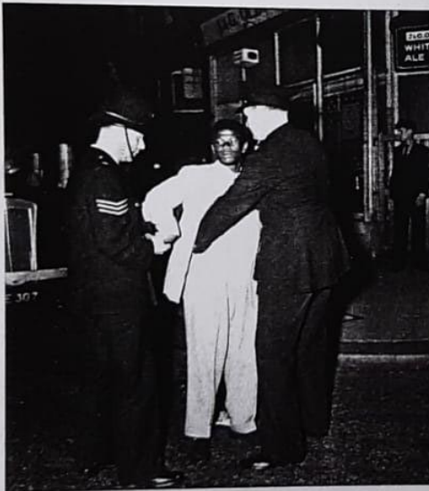
El término cultura también refiere a los conflictos étnicos. En la imagen, dos policías registran a un joven de raza negra durante disturbios raciales en la ciudad de Londres.

En el siglo XIX, el término cultura tomó un significado antropológico, y así, se la definió como la condición característica que comparte una sociedad o un grupo social en un momento determinado. Esta condición engloba los hábitos lingüísticos, las tradiciones populares, las costumbres, las creencias, las maneras de proceder, las formas de valoración y la visión del mundo de esa sociedad. Por lo tanto, de acuerdo con estos nuevos conceptos, todos los hombres están inmersos en una cultura específica que abarca todos los ámbitos en los cuales ellos son partícipes, desde la naturaleza hasta las organizaciones sociales.