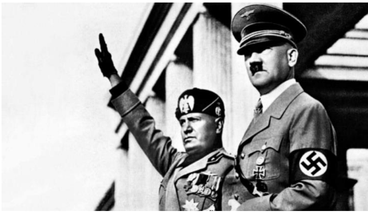
Adolf Hitler y Benito Mussolini

Observación del siguiente material audiovisual : https://m.youtube.com/watch?v=7R2EqwkyE3s Definan