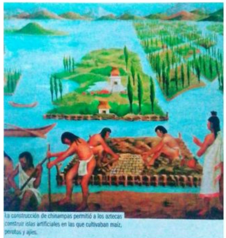
La construcción de chinampas permitió a los aztecas construir islas artificiales en las que cultivaban maíz, porotos y ajíes.

La sociedad azteca estaba jerárquicamente estructurada, con nobles, guerreros, y campesinos en diferentes niveles. La economía se basaba en la agricultura intensiva, el comercio y el tributo de los pueblos conquistados, lo que les permitió controlar recursos clave.