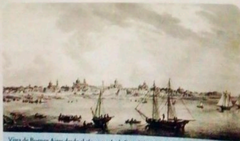
Vista de Buenos Aires desde el río, aguada de Brambila de 1794. La designación como capital del nuevo virreinato y la apertura del puerto permitieron el rápido desarrollo de Buenos Aires. Llegaron nuevos habitantes, se intensificó el comercio de cueros y grasa Tucumana y se modernizó la ciudad, por lo que mejoraron las condiciones de vida de la población.

Además, se dividió el territorio de cada virreinato en intendencias, bajo la autoridad de un gobernador intendente que dependía del virrey. De esta manera, con una mayor división administrativa, se buscaba acelerar la toma de decisiones, regular el poder de los virreyes y evitar la corrupción de los funcionarios, ya que estos se controlarían entre sí.