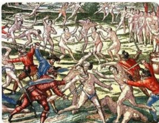
Conquistadores españoles atacando un poblado indígena. Ilustración de Theodore De Bry de 1590.

Después de dominar las islas a las que había llegado Colón, los españoles sometieron el Imperio azteca y las regiones próximas, como el área maya de Yucatán, entre 1519 y 1530. A partir de entonces y hasta 1550, incorporaron los territorios del Imperio incaico. Posteriormente, las nuevas ocupaciones se hicie-