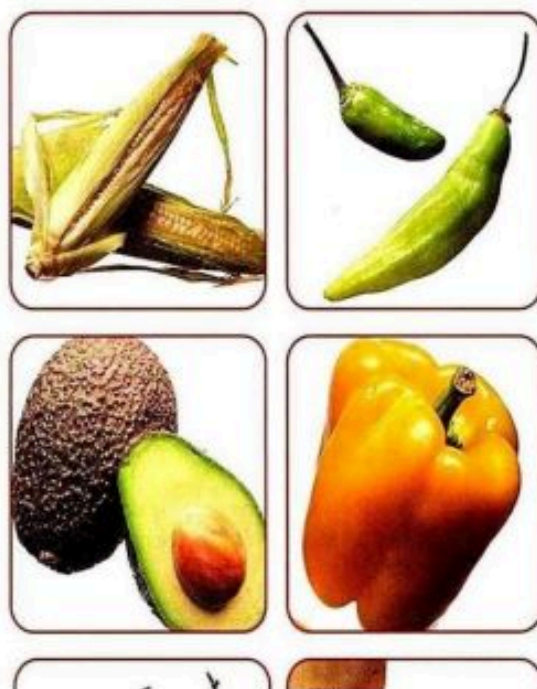
Alimentos originarios de América.

Al tiempo que promovía adelantos científicos y tecnológicos, la expansión conmovió la mentalidad de los europeos. La ampliación del mundo conocido puso en duda muchas ideas consagradas durante siglos. El ansia por el saber y por conocer lo nuevo cuestionó el lugar de la tradición y las verdades indiscutibles. Los contactos con sociedades ignoradas hasta entonces, al tiempo que provocaron conflictos y enfrentamientos, hicieron evidente la variedad y diversidad de culturas humanas.