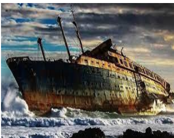
El Cuento Extraño

Ahora te invitamos a introducirnos en el cuento Extraño , indagando sus particularidades y estableciendo las diferencias en relación al cuento Fantástico.