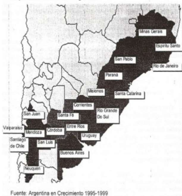
Mapa 2.1.: Corredor de Negocios

los cancilleres del Mercosur se reunieron en Buenos Aires para analizar los próximos pasos de un bloque que quedó dividido el mismo día que cumplió 30 años: el viernes 26 de marzo pasado. Por un lado, están los planteos de menos barreras arancelarias y más integración al mundo de Uruguay, Paraguay y Brasil; por otro lado, en Córdoba, los empresarios salen a la defensa del Mercosur por considerarlo el mercado más importante para las exportaciones locales; apuestan a una mayor integración y advierten que esto no se contraponen a fortalecer la competitividad de las pymes.