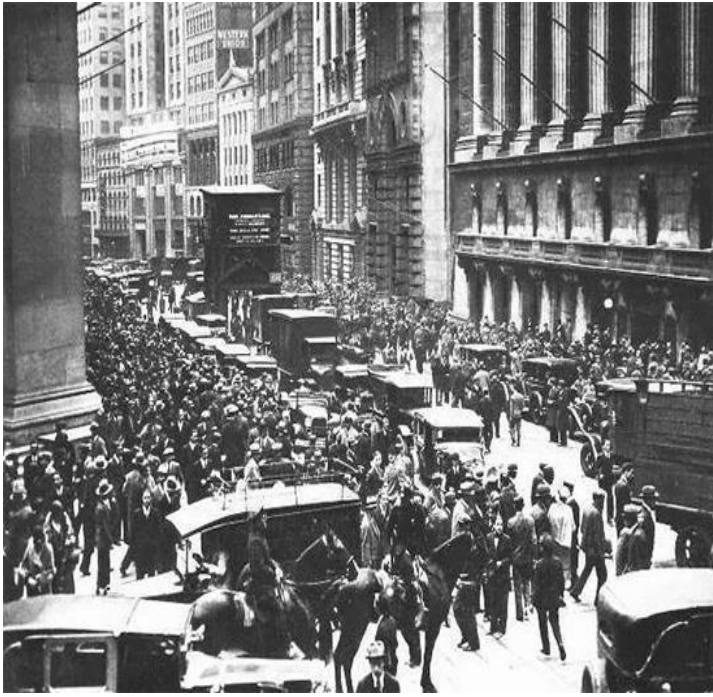
Multitud en Wall Street luego de la caída de la bolsa de Nueva York, 1929.