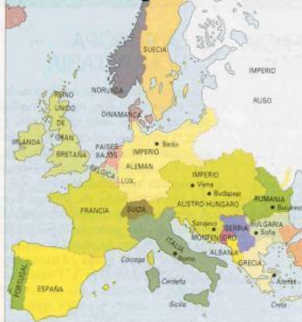
Mapa 1: Europa en 1914, antes de la guerra.