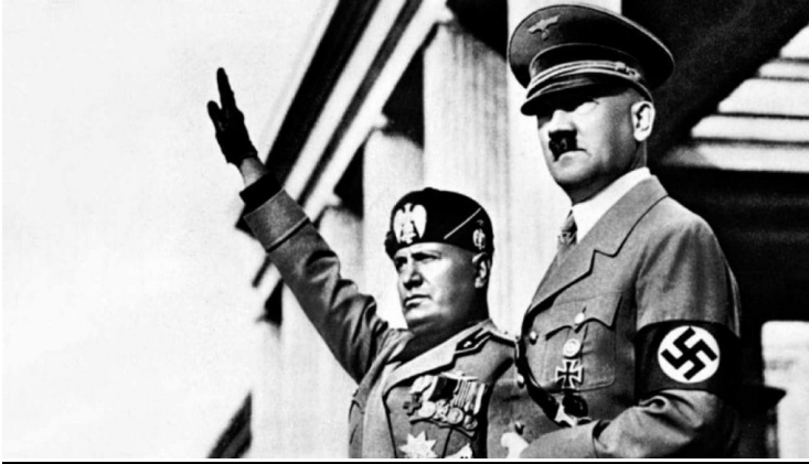
Adolf Hitler y Benito Mussolini

Observación del siguiente material audiovisual : https://m.youtube.com/watch?v=7R2EqwkyE3s