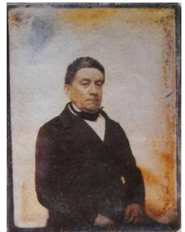
La derrota de Paz en 1831 marcó el fin de la Liga Unitaria.

La Liga Unitaria reunió a Córdoba, Salta, Tucumán, Catamarca, Mendoza, San Juan, San Luis y Santiago del Estero, con el fin de constituir un gobierno nacional. Como contrapartida, Buenos Aires y las provincias del litoral firmaron, en 1831, el Pacto Federal en el que se comprometieron a actuar