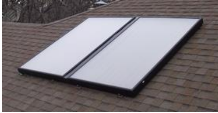
Dos colectores solares planos instalados en un tejado