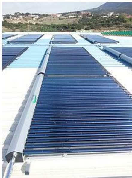
Imagen: Sistema de paneles solares de tubos de vacío.

También una ventaja adicional de los tubos de vidrio es su mayor versatilidad de colocación, tanto desde el punto de vista práctico como estético. Al ser cilíndricos, toleran variaciones de hasta 25° sobre la inclinación idónea sin pérdida de rendimiento. Por este motivo es posible adaptarlos a la gran mayoría de las edificaciones existentes. Otro aspecto interesante es que necesitan una superficie de captación solar menor debido a su mayor eficiencia. Además por su forma cilíndrica también son mucho más eficientes, ya que reciben los rayos solares perpendicularmente durante todo el día. Por el contrario los colectores planos son sólo efectivos cuando tienen el sol perpendicularmente.